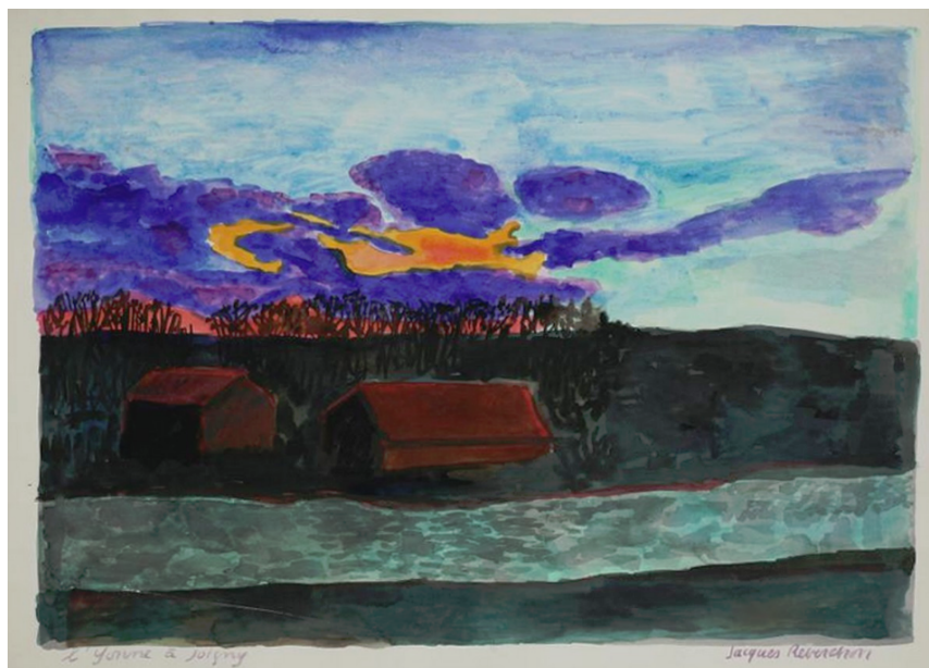
Jacques Reverchon L'Yonne à Joigny-aquarelle

52 Quai des Orfèvres 75001 Paris 11h-19h, vernissage samedi 2 15-20h